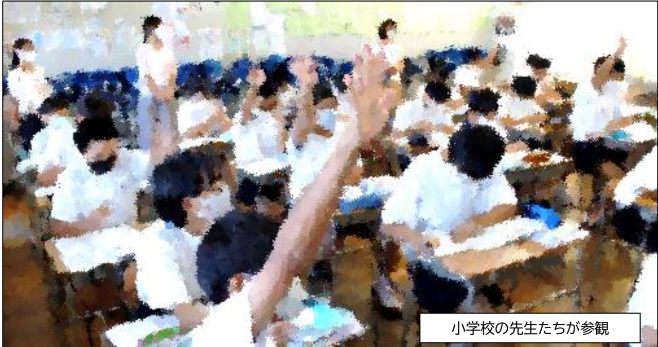
小学校の先生たちが参観