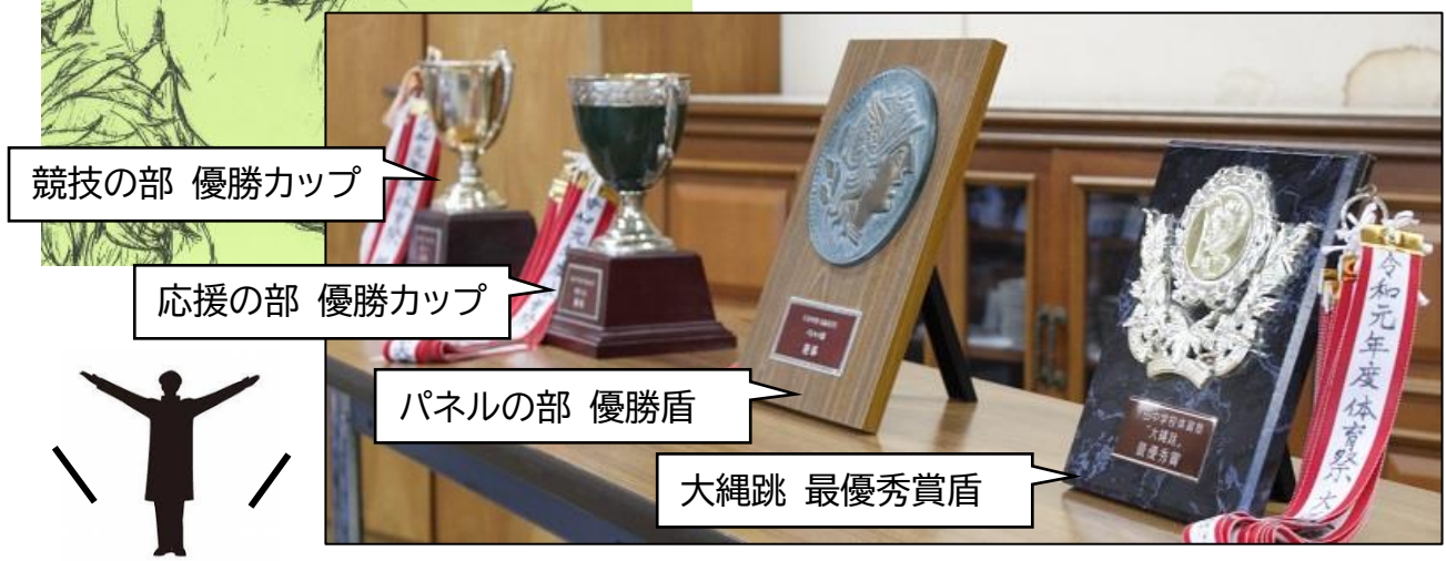
競技の部 優勝カップ