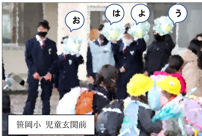
笹岡小 児童玄関前