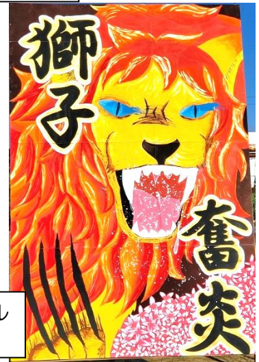
迫力の構図と繊細なタッチの両軍パネル 甲乙つけられない出来栄でした。

地域、保護者の方々に、今年度初めて下田中生の活躍を披露する場。最高の生徒たちの最高のパフォーマンス。感染症と熱中症の対策を取ったうえでの開催。全ての人が元気になれた秀嶺体育祭でした。