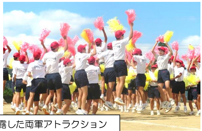
練習の成果を見事に披露した両軍アトラクション 全員が笑顔で踊る姿が印象的でした。