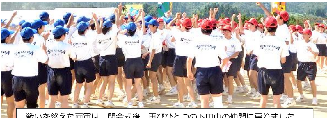
戦いを終えた両軍は、閉会式後、再びひとつの下田中の仲間に戻りました。