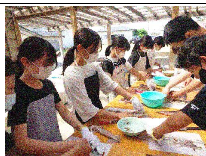
体験活動「イカ裂き」