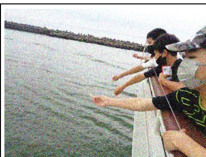
フェリーでカモメにエサやり