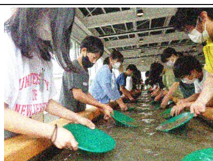
一攫千金、砂金とり