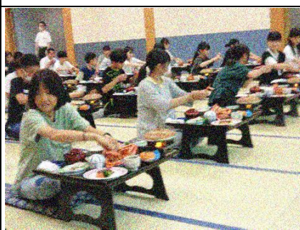
夕食は豪華なカニ、ひとり一杯