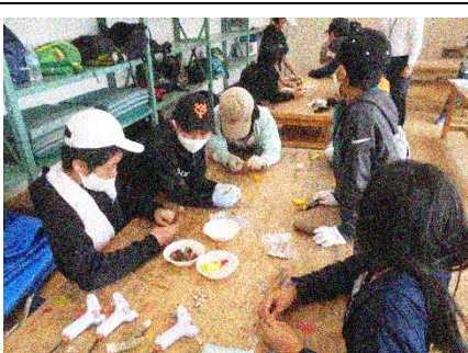
木工作『小枝のもっくん』