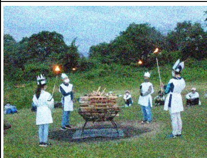
厳粛な中でキャンプファイヤー