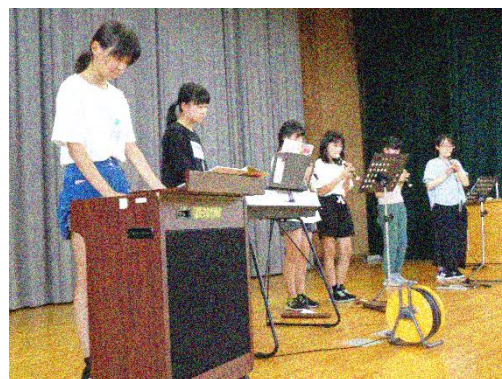
『なんでも選手権』(7/6)で、自分が得意なことをアピールしました。

夏休みは、子どもたちにとって家庭や地域が大切な学びの場になります。たくさんの体験をして一回り大きくなった子どもたちと会えるのが今から楽しみです。