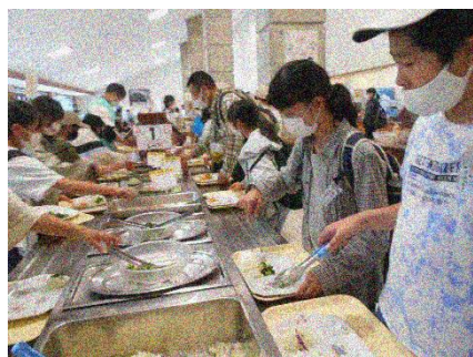
お楽しみはバイキングの食事