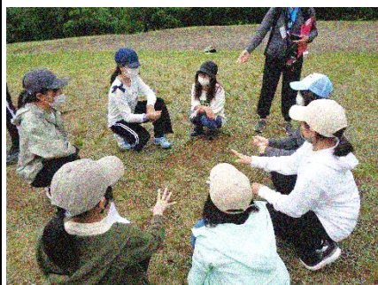
他校の仲間との親睦を深めます