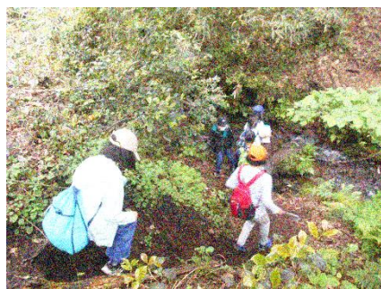
妙高の自然の中でリエンテリング