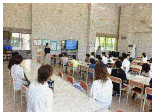
『ネットトラブル講習会』(7/6)で、真剣に聞く5・6年生。