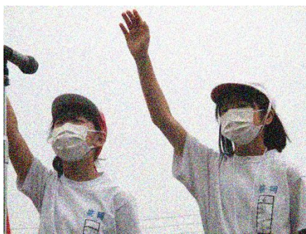
開会式・選手宣誓