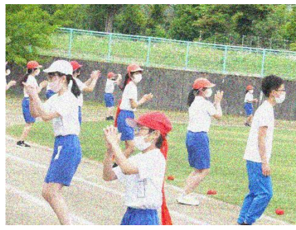
全校ダンスパフォーマンス『やってみよう』