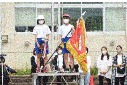
閉会式・赤白団長感想発表