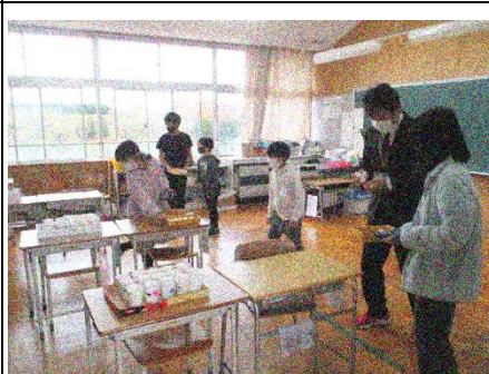
5班「ゴーゴーピンポンシュート」