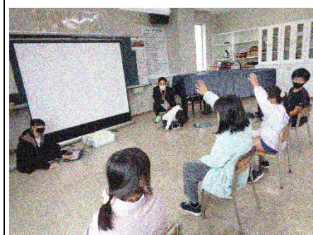
3班「3時のおやつは何の音？」