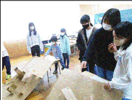
4班「しろくまストライクボール」