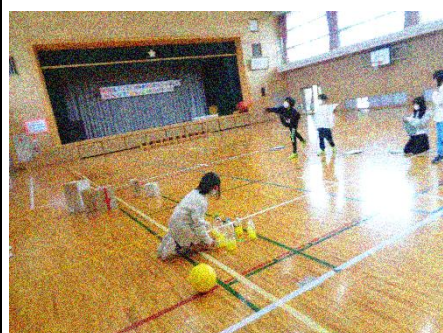
1班「パワーボウリング」