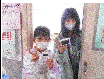
2班「ニコニコ宝さがし」