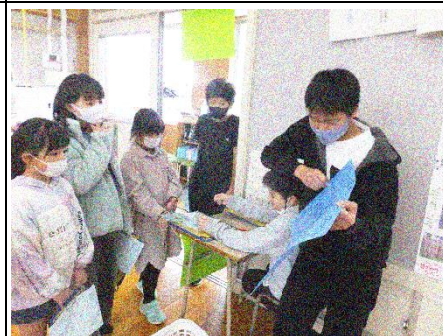
6班「パン屋さんのストラックアウト」