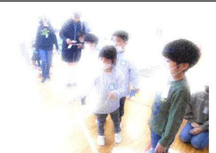
園児がやるのを見つめる優しい目