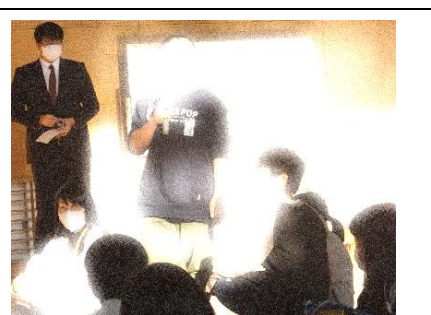
閉会式で感想発表

ささしょうまつりは、さいしょはどういうことかわからなかったけど、ほんばんのときはできました。〇〇さんがしっかりおしえてくれて、すぐにできてよかったです。みんなもおしえてくれてうれしかったです。(1年・〇〇さん)