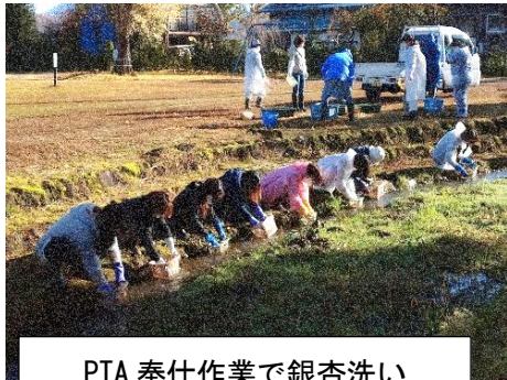
PTA 奉仕作業で銀杏洗い