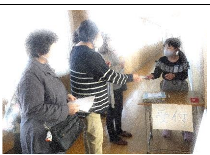
保護者・地域の方からも大勢おいでいただきました