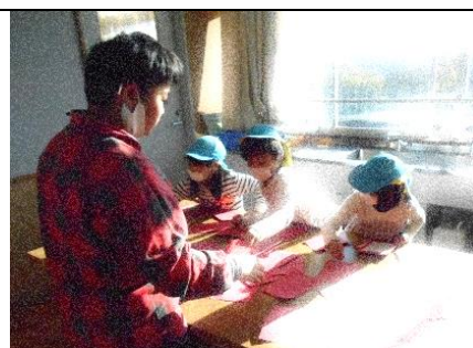
園児を励ます優しい言葉