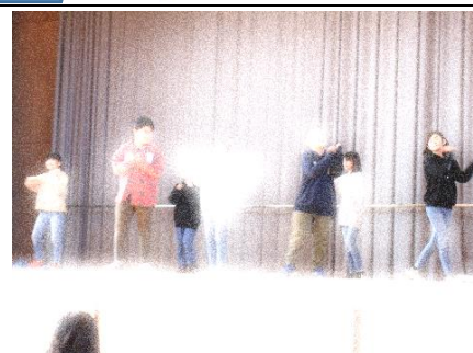
ダンスクラブのパフォーマンス