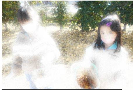
1年生も銀杏集めデビュー