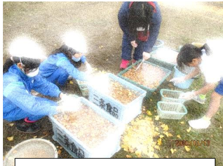
3年生が全校に呼び掛けて

3年生は興隆庵の庵主様から昔の笹岡小のことや「銀杏文庫」についてお話を聞きかせていただきました。このあと、総合学習で、銀杏販売、「銀杏文庫」の購入と、活動を進めていきます。