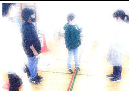
ルールの説明も大切な仕事です