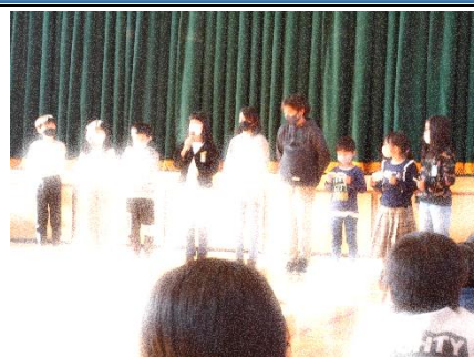
「みんな来てね」開会式でお店の紹介