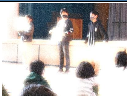
6年生の実行委員がめあてを説明