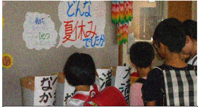
「どんな夏休みでしたか？」に投票しました