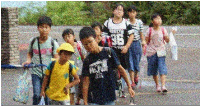
大きな荷物を両手に持って登校する子どもたち

平成30年8月30日 三条市中野原 329 TEL(0256)46-2024 FAX(0256)41-2660