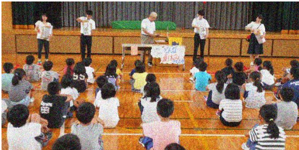
始業式では投票結果の発表をしました