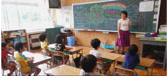
各学級で夏休みの思い出を交流していました