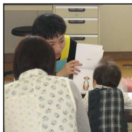
ブックスタート会場で、『びよーん』をみつめる子を発見。とても、楽しそうでした。

「親子で読書写真紹介」というコーナーでは、「親子読書のはじめのいっぽ」として、ブックスタートの様子を掲載しています。