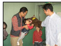
講座で登場した、おおかみお君とさよならです。