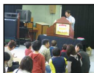
「にらめっこしましょ」を読んだ後、仲良くにらめっこをしました。