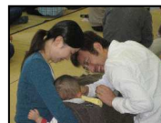
紙芝居のケーキを、思わず食べに来てしまう子もいました。