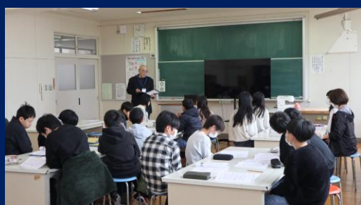
6年生体験入学～第2回ブリッジスクール～(11月24日)

地域・保護者の皆様にご参観いただきました。 吹奏楽部は7日に長岡市立劇場で演奏してきました。