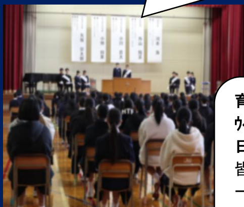
令和8年度生徒会役員選挙 立会演説会と投票(12月4日) 新生徒会の四役が決まりました。

育穂学級(特別支援) ウインターフェスティバル(12月4日) イストライオンズクラブの皆様が扮装して来校！ 一緒に活動しプレゼントをくださいました。