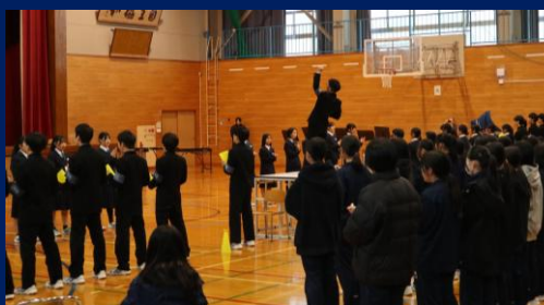
今年度最後の激励会「アンサンブルコンテスト激励会」(12月5日)