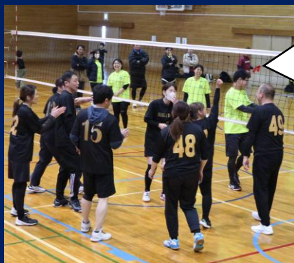
四つ葉学園 PTAバレーボール大会(12月6日) 手前が四中チーム！

生徒会体育委員会企画・運営 球技大会(クラスマッチ) ドッジボールを楽しみました。