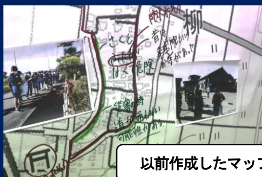
以前作成したマップ