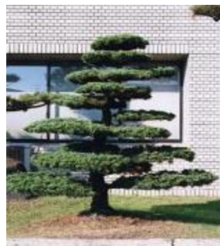
三条市の木 五葉松