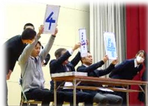
学級対抗 あいさつキャンペーン (生徒会がんばっています!)