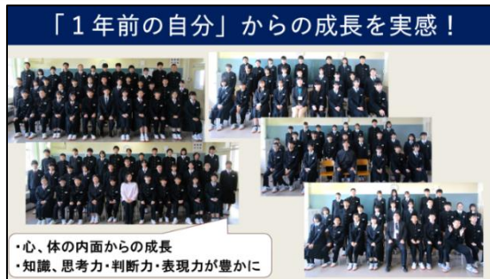
・心、体の内面からの成長 ・知識、思考力・判断力・表現力が豊かに

この1年間の成長を自信につなげ、来年度はさらに、一人一人が Jump up していくことに期待します。