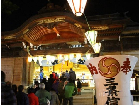
三條八幡宮 献灯祭