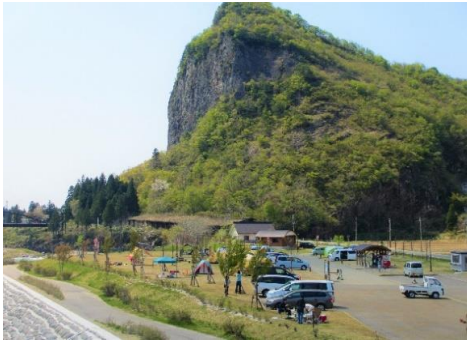
CAPTAIN STAG® 八木ヶ鼻オートキャンプ場

市の面積 431.97Km 2 (国土交通省国土地理院全国都府県市区町村別面積調:令和元年7月1日) 市の位置 東経 138°57'42" 北緯 37°38'11" (三條市役所三條庁舎の位置を測定基準とする)