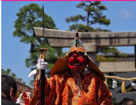
三条祭り 大名行列