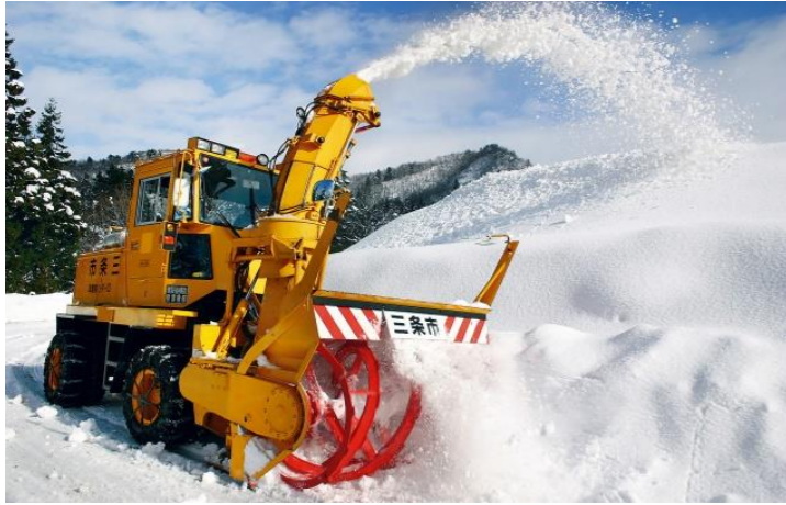
三条市の除雪風景