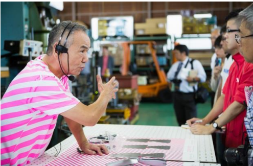
燕三條 工場の祭典