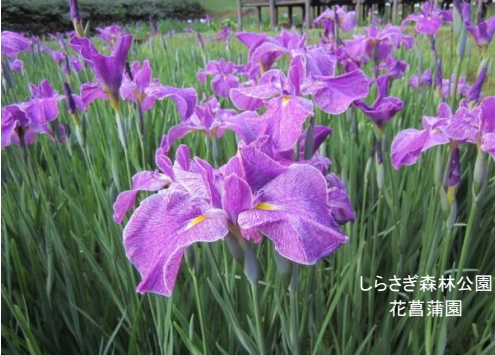
しらさき森林公園 花菖蒲園