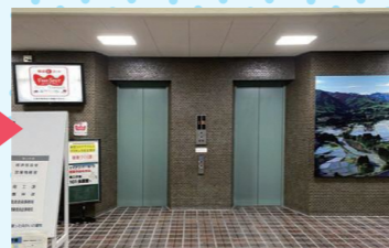
エレベーターで5階または4階へ