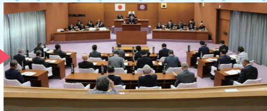
傍聴席からの議場