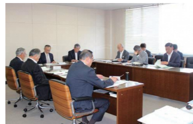
付託された全議案について、全員異議なく原案の通り決定すべきものとした。

当初予算にも計上した通り、ものづくりプラットフォームの運営に補助を行っている。昨年策定した三条市経済ビジョンの実行に当たり、同プラットフォームの役割は重要であると考えており、今後の関わり方についても検討、検証し、その都度、議会での審議をお願いしたい。