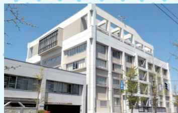
三条市役所三条庁舎