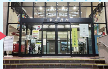
三条庁舎正面玄関前