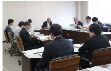
付託された議第17号は全員異議なく原案の通り決定すべきものとした。

支援事業費は、一般廃棄物収集運搬の許可を有する市内の事業者へのヒアリングに基づき1日当たりの燃料給油量を算出し、収集運搬車1台当たりの支援金を算出した。各事業者の保有台数により算定している。