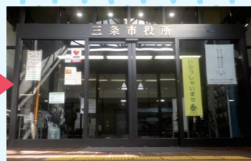
三条庁舎正面玄関前