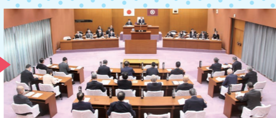
傍聴席からの議場