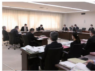
付託された議案のうち、議第1号、議第3号、議第4号および議第25号は賛成多数で、その他は全員異議なく原案の通り決定すべきものとした。

A 今回、多額の基金を取り崩して保険料を抑えたとしても、今後の長期的なシミュレーションにおいては、保険料が跳ね上がる恐れがある。安定的な運営を行うことが保険者の役割であると考えている。