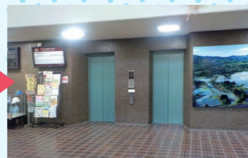
エレベーターで5階または4階へ