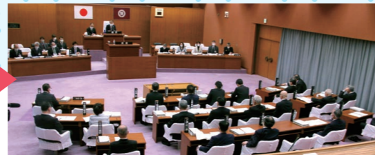
傍聴席からの議場