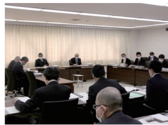
付託された議案のうち、議第1号は賛成多数で、その他は全員異議なく原案の通り決定すべきものとした。

A ミズベリングで実施していたふわふわドーム等の遊具を用いたイベント等を感じ症対策上、実施が難しい部分について減額した。今年度は、ふわふわ遊具に代わりウェブ等を活用したイベント等を実施した。