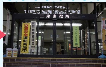
三条庁舎正面玄関前