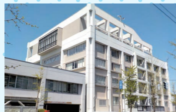
三条市役所三条庁舎