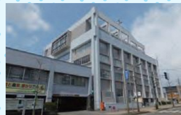
三条市役所三条庁舎