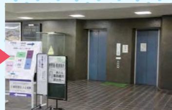
エレベーターで5階または4階へ