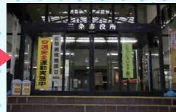
三条庁舎正面玄関前