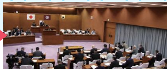
傍聴席からの議場