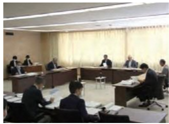
付託された全議案について、全員異議なく原案の通り決定すべきものとした。