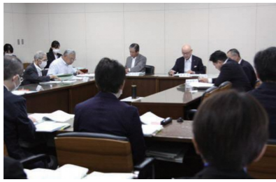
付託された全議案について、全員異議なく原案の通り決定すべきものとした。

A いい湯らていは、全館空調の設計であり、網戸を設置していない。今回の新型コロナウイルス対策のために外気を入れなければならず、網戸を入れないと虫が入ることから整備させていただく。