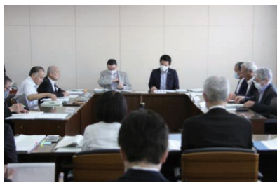
付託された全議案について、全員異議なく原案の通り決定すべきものとした。

A 市長記者会見やSNSなどで情報発信に努めたが、足りなかった部分については真摯に受け止めて検討し、今後何らかの支援を行う際には対応したい。