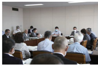
付託された議案のうち、議第5号、議第6号、議第21号および報第3号は賛成多数で、その他は全員異議なく原案の通り決定すべきものとした。

Q 耐震改修の主な工事内容は何か。 A 壁をコンクリート等で補強し、外壁に付随する柱に高強度ポリエステル繊維を巻いて補強する。また、壁と柱の間にスリットを入れ左右の揺れを