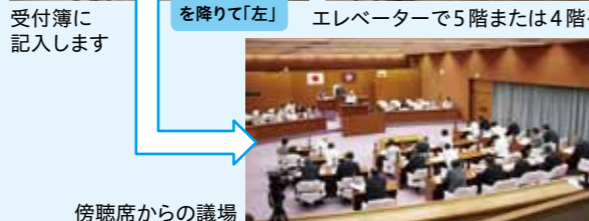
5階議場の場合 会議の資料です