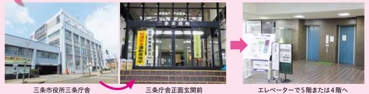
三條市役所三條庁舎