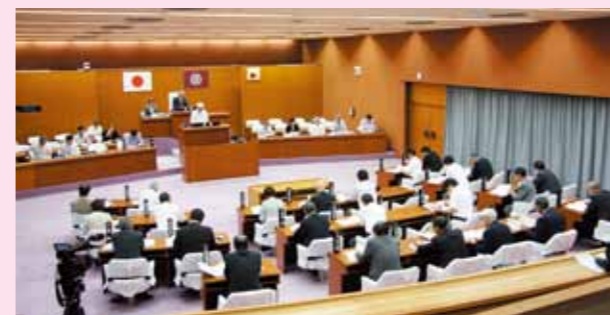
傍聴席からの議場