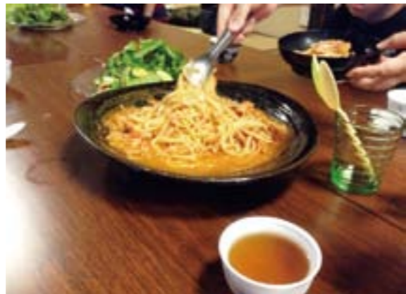
新発田市のこども食堂

問 子どもの居場所として、夏休みに公民館を開放したと聞く。調理実習など公民館事業として実施してはどうか。