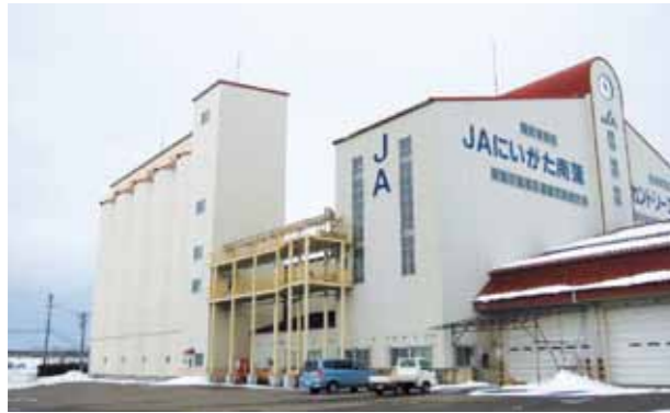
カントリーエレベーター