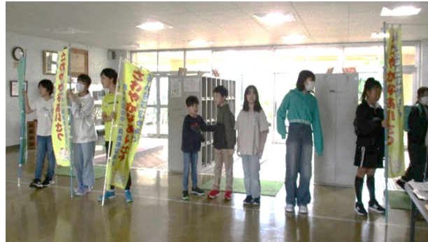
四つ葉学園あいさつ運動の様子（保内小）