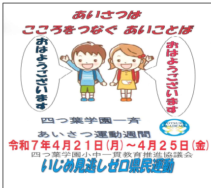
四つ葉学園あいさつ運動ポスター

4月21日（月）から25日（金）まで、第1回四つ葉学園あいさつ運動に取り組みました。第1回目は、委員会や縦割り班など、各学校それぞれであいさつ運動の取組を行いました。「元気な声で」「相手の目を見て」「自分から進んで」あいさつをすることをめあてに頑張りました。玄関や各教室など元気な声が響き渡り、各学校とも充実した取組になりました。運動の期間だけでなく、今後も継続して、元気な声で自分から進んであいさつができる子どもたちになるよう、四つ葉学園全体で地域の方々と共に取り組んでいきたいと思えます。第2回目は、第四中学校の代表生徒が母校に行き、小学生と一緒にあいさつ運動を行います。