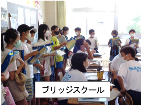
ブリッジスクール