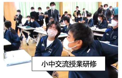
小中交流授業研修