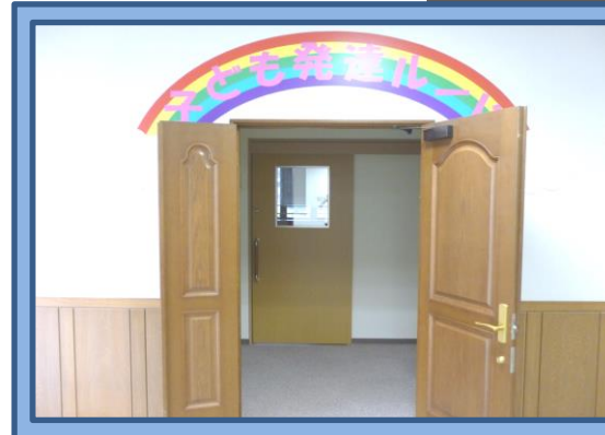
栄庁舎3階 指導室入口