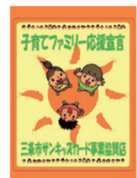
サンキッズカード事業協賛店ステッカー

該当になっているご家庭で、まだ発行されていない方や3人目のお子さんを出産された方は、ぜひサンキッズカードをご利用ください。