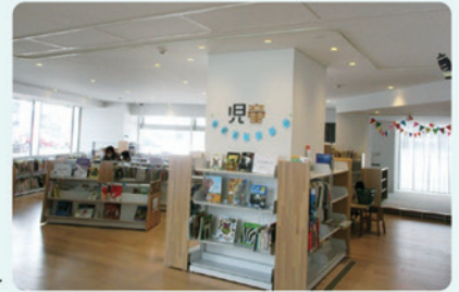
図書館本館 児童コーナー