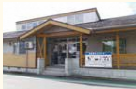
月岡保育所 子育て支援センター