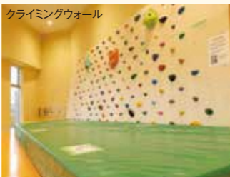
クライミングウォール