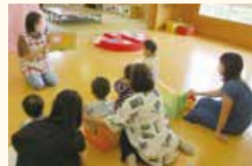
保内保育所 子育て支援センター