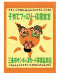
サンキッズカード事業協賛店ステッカー