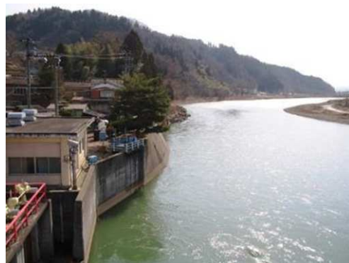
清流五十嵐川（籠場取水場）

また、遅場浄水場の水源である守門川上流域の湧水は、人里離れた山地で産業活動が全くないため、極めて良質な水源となっています。