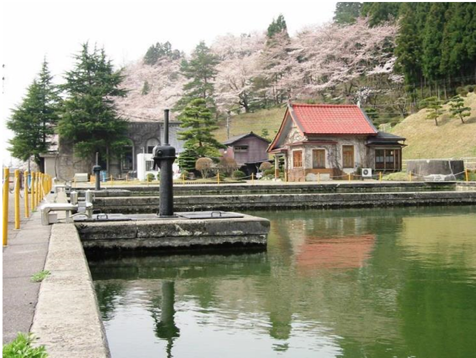
大崎浄水場（国登録有形文化財）

水質検査は、水道水が水質基準に適合し安全であることを保証するために不可欠であり、水道水の水質管理において基本となるものです。