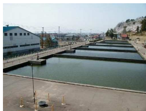
大崎浄水場 緩速ろ過池

浄水場では、①伏流水を砂層でろ過処理後、塩素消毒を行う緩速ろ過処理方式と、②薬品を用いて凝集沈澱を行い、急速ろ過処理後、塩素消毒を行う急速ろ過処理方式の2種類の処理方式で浄水処理を行い、それぞれ配水池から①自然流下による方式と②配水ポンプによる圧送の2系統で市内へ給水しています。