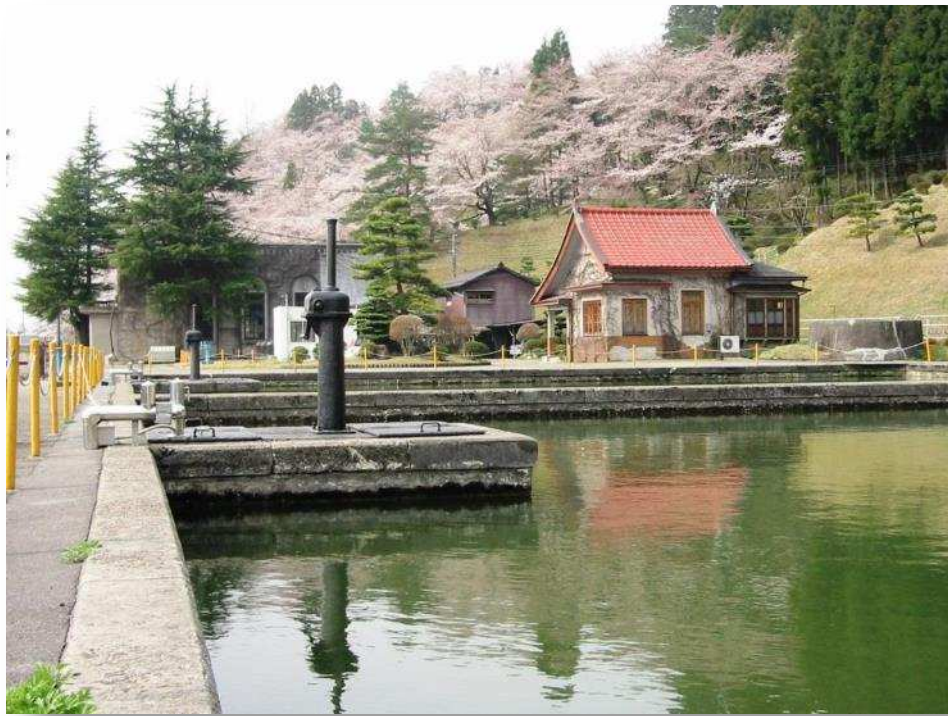
大崎浄水場（国登録有形文化財）

水質検査は、水道水が水質基準に適合し安全であることを保証するために不可欠であり、水道水の水質管理において基本となるものです。