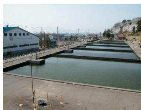
大崎浄水場 緩速ろ過池

浄水場では、①伏流水を砂層でろ過処理後、塩素消毒を行う緩速ろ過処理方式と、②薬品を用いて凝集沈澱を行い、急速ろ過処理後、塩素消毒を行う急速ろ過処理方式の2種類の処理方式で浄水処理を行い、それぞれ配水池から①自然流下による方式と②配水ポンプによる圧送の2系統で市内へ給水しています。