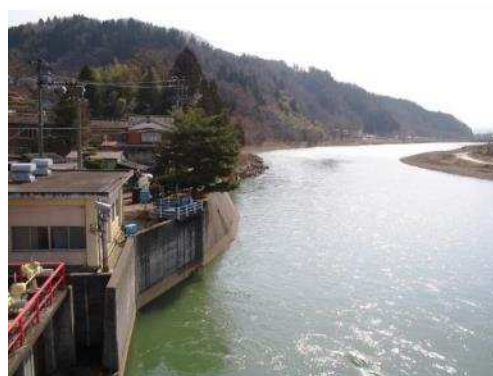
清流五十嵐川（籠場取水場）

また、遅場浄水場の水源である守門川上流域の湧水は、人里離れた山地で産業活動が全くないため、極めて良質な水源となっています。