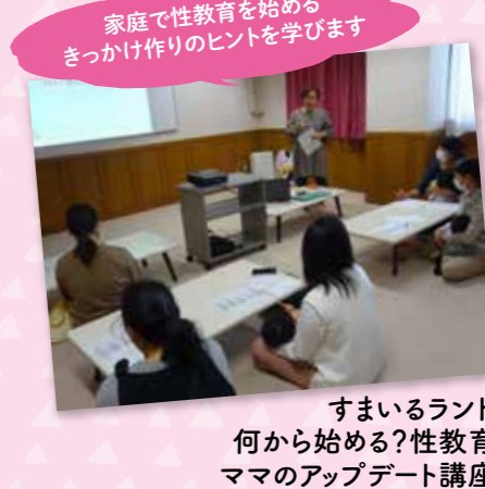
家庭で性教育を始めるきっかけ作りのヒントを学びます