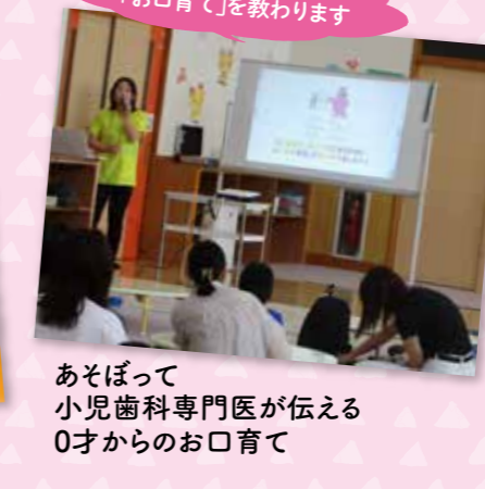
歯が生える前からできる「お育て」を教わります