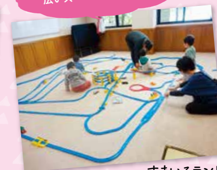
すまいるランド プラレール・トミカであそぼう