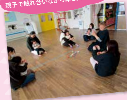
田島わくわくこども園 子育て支援センター 親子でリトミック