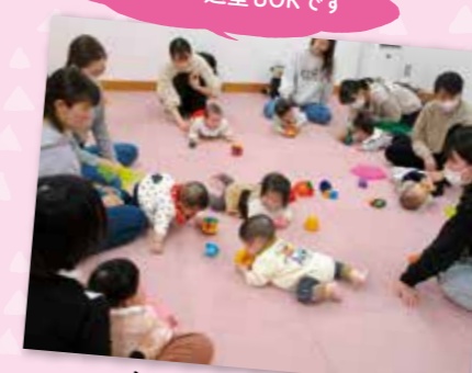
あそぼって いっしょにあそぼ! 6～8カ月ベビちゃんひろば