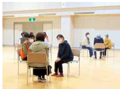
傾聴体験セミナーの様子

と き… 3月11日(水) 午前9時30分～11時30分 ところ… 三条東公民館 対 象… おおむね55歳以上 定 員… 先着20人 申込先… セカンドライフ応援ステーション (市役所第二庁舎内) ☎47-0033