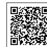
国税庁LINE 公式アカウント

申し込み LINEで事前に予約ください。 ①国税庁LINE公式アカウント(右記)を友だち登録 ②メインメニューの「確定申告相談の申込(個人の方)」を選択し、案内に沿って申し込む。