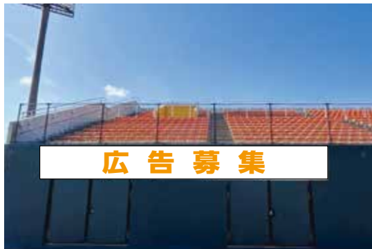
①内野側グラウンド ラバーフェンス(外野席側) サイズ縦1.5m×横10m、橙1色