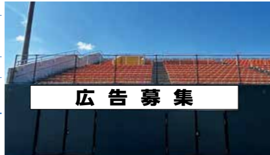
①内野側グラウンド ラバーフェンス(外野席側) サイズ縦1.5m×横10m、橙1色