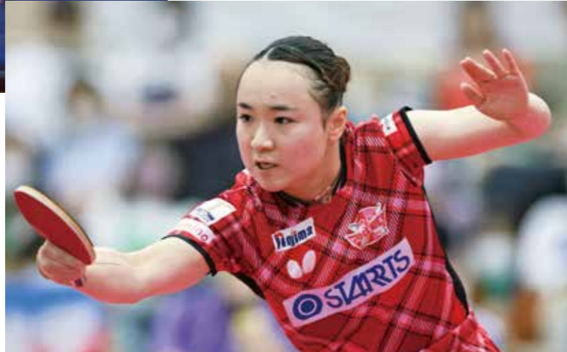
*出場選手は当日発表します。