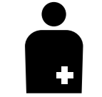
オストメイトマーク

人工肛門や人工ぼうこうを使用している人（オストメイト）は、入口にオストメイトマークが表示されたオストメイト対応の多機能トイレを使用します。