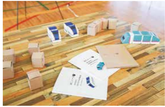
過去の入賞作品 はこノート (テーマ「箱」) ページを切り離し、箱を作れるノート

「つなぐ」をテーマに、「欲しいもの」「あるといいもの」のアイデアを募集します。イラストか模型で応募ください。燕三条のものづくりの技術とつなぎ、試作・商品化されることがあります。