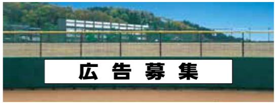
①外野側グラウンドラバーフェンス(1塁側) サイズ縦1 メートル ×横10 メートル 、橙1色