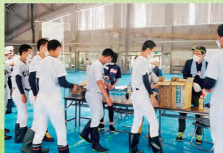
活動するボランティア

また、水害の被害にあった家は掃除が大変です。水を含んだ畳は100kgの重さになり、一人暮らしのお年寄りの手には負えません。